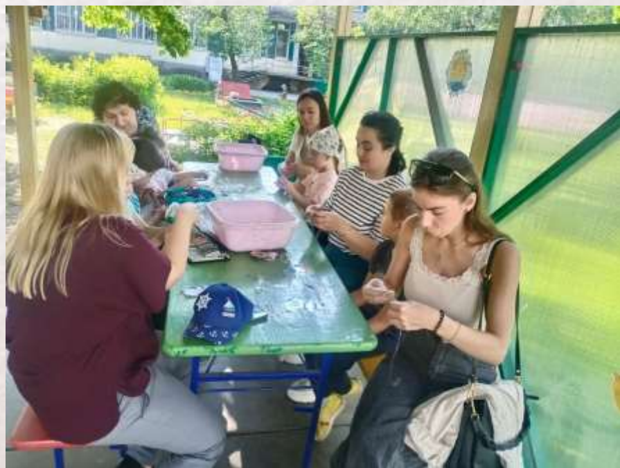
Мастер-классы для родителей