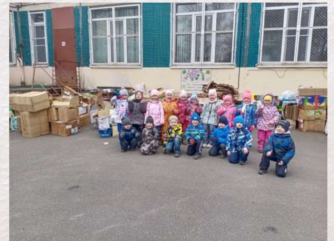
Участие в экологических акциях по сбору макулатуры