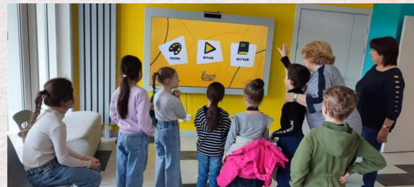
Экологическая игра «Эко-дозор» Центральная районная библиотека СПб ГБУК ЦБС Красносельского района