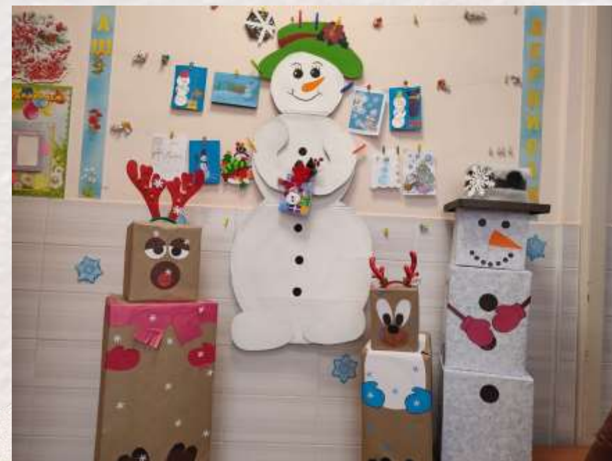
Изготовление атрибутов совместно с родителями