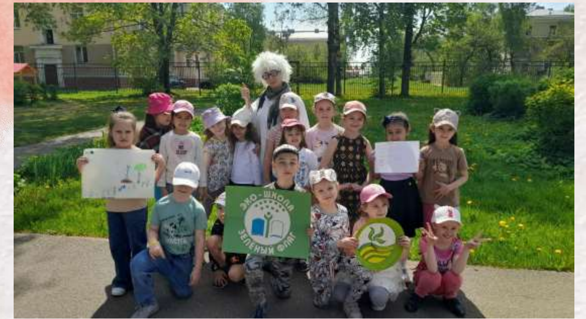
Образовательный экологический терренкур совместно с лицеем №244