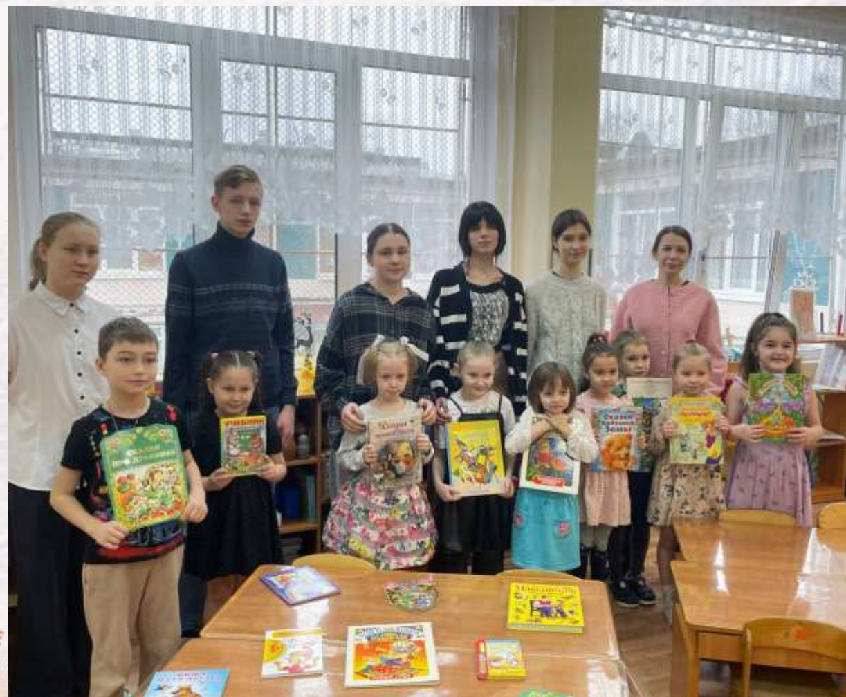
Совместная акция с лицеем №244 «День книгодарения»